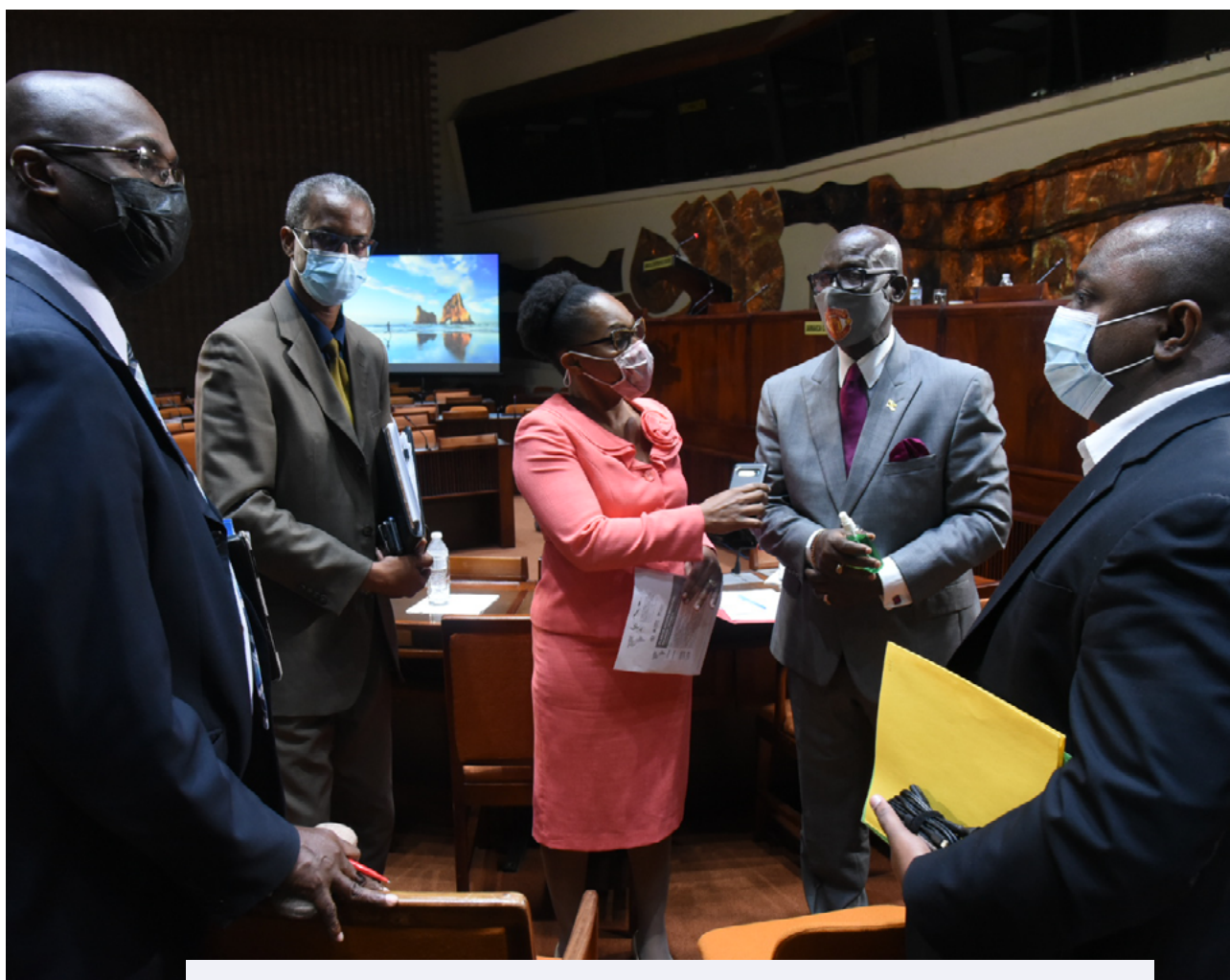
VII Plataforma Regional para la Reducción del Riesgo de Desastres en las Américas y el Caribe (PR21)

Por último, cabe destacar que se ha alcanzado un nuevo nivel de cooperación entre las redes, la Junta y los equipos de la UNDRR en Ginebra y en las regiones. Me gustaría dar las gracias a las redes por sus incansables esfuerzos e ideas creativas para hacer realidad el Marco de Sendai en sus regiones, a la Junta por sus iniciativas para liderar el camino y, por supuesto, a Mami Mizutori y al equipo de la UNDRR por su incansable apoyo.