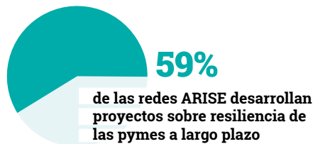
Figura 3: Compromiso de la red ARISE con las pymes